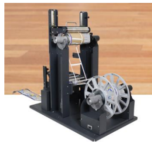
Label Matrix Removal System